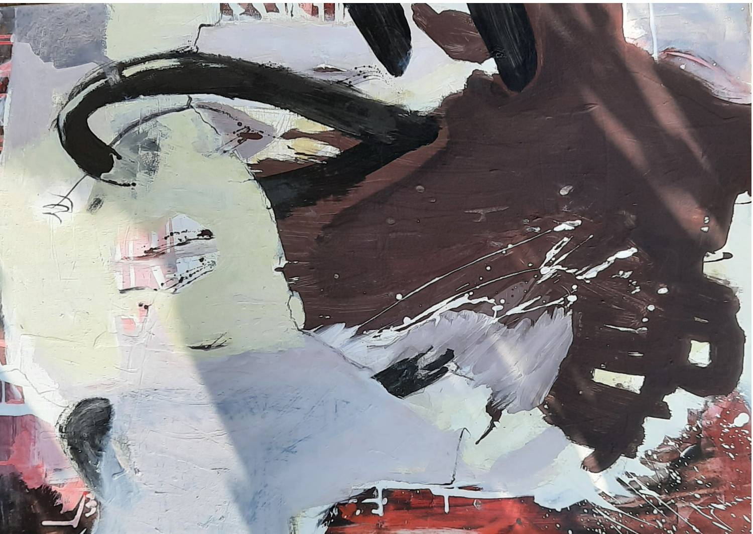
Ohne Titel, 2024, Acryl auf Leinwand, 95 x 70 cm